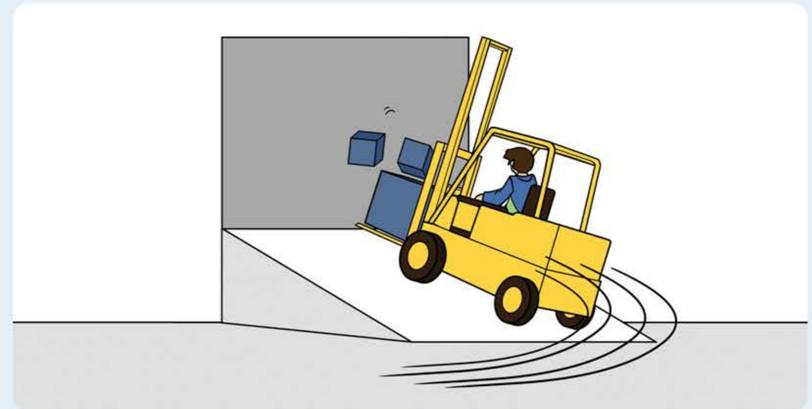
Kurven langsam fahren