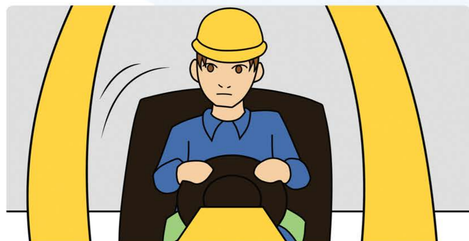
Sitzen bleiben, nicht abspringen