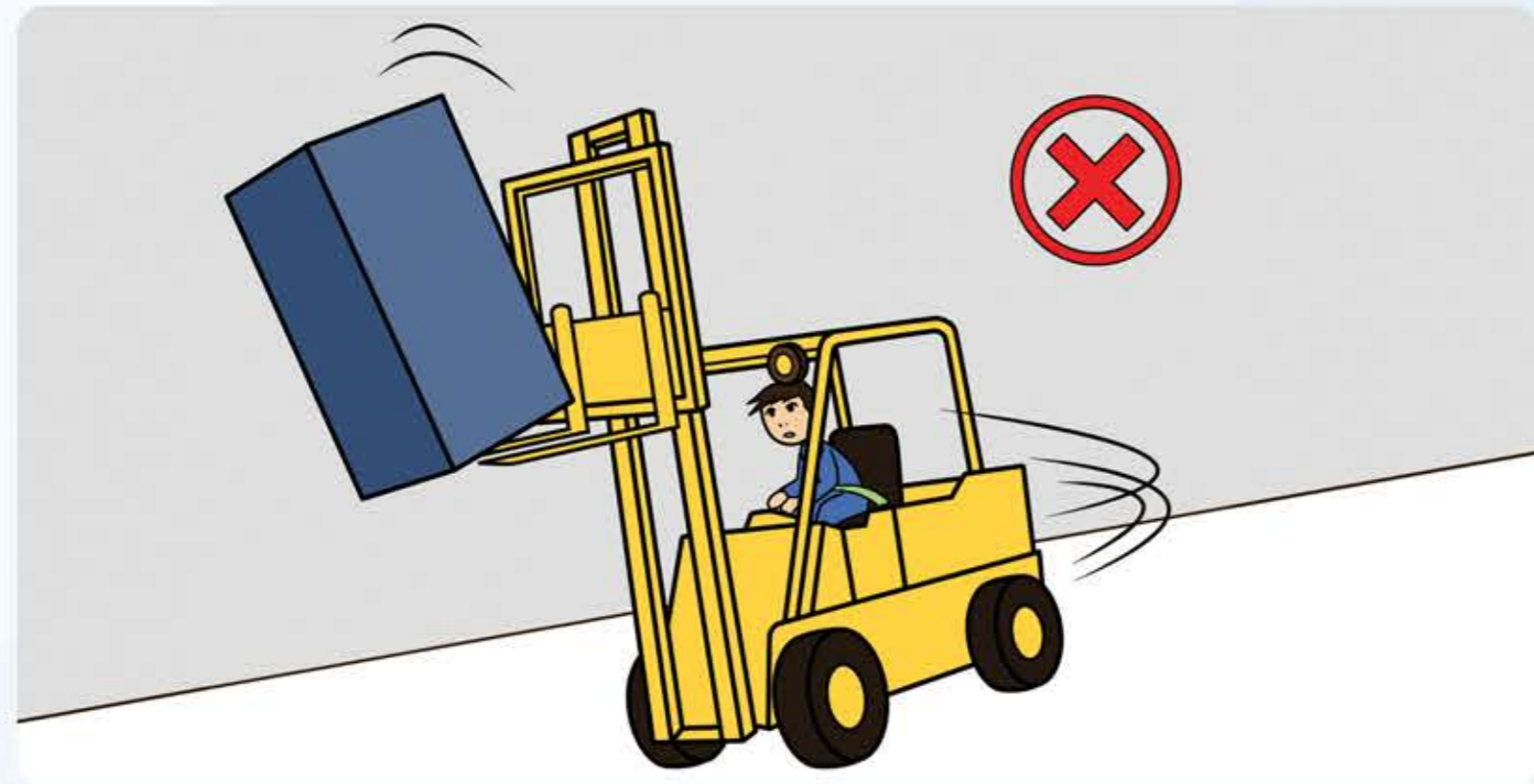
Kein Drehen und Fahren mit angehobener Last