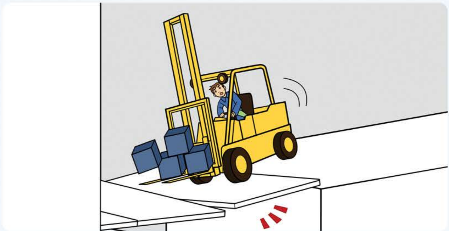
Besondere Vorsicht auf Rampen