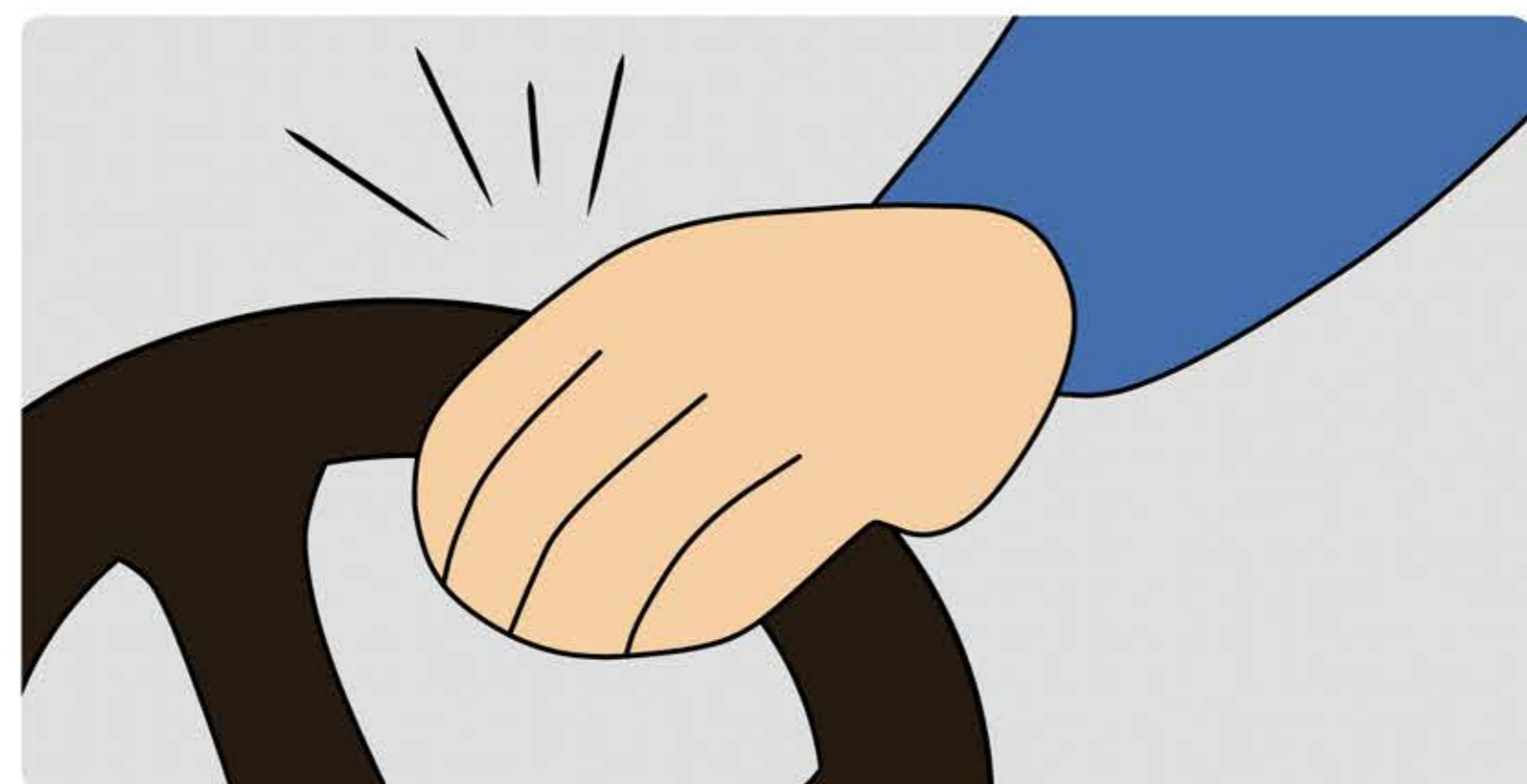
beide Hände fest ans Lenkrad